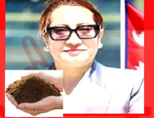
विद्या श्रेष्ठ श्रम संस्कृति पार्टी