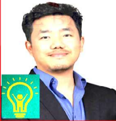
सुरेन्द्र लामा योञ्जन उज्यालो नेपाल पार्टी