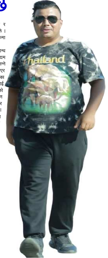
लिन सहयोग गर्नुभयो, उहाँको मरिचको योगदान जीवनभर विर्सन सकिँदैन । बोकी पृष्ठ ७ मा..

हो त्यतिबेला सह-चालक बनेर हिँडेपछि केही वर्षमा चालक भइन्थ्यो । २०५८ सालमा सहचालकका रूपमा यात्रा शुरू गरे । केही सिप सिक्नुपर्छ भन्ने हुट्टुटी थियो । गाउँकै काका चालक हुनुहुन्थ्यो, उहाँकै सानिन्ध्यामा सहचालक बने । सानिदेखि मेहनतमा विश्वास गर्ने मान्छे, काकाले पनि माया र विश्वास दिनुभयो, गाडी चलाउन सिकाउनुभयो, मेरो सपना नै चालक बन्ने भएपछि मैले त छिट्टै गाडी सिकिहाले नि । छोटो समयमै राम्रोसँग गाडी चलाउन सक्ने भएँ । मेहनत देखेर काकाले सवारी अनुमति